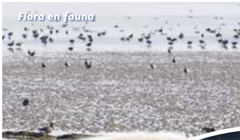
Flora en fauna