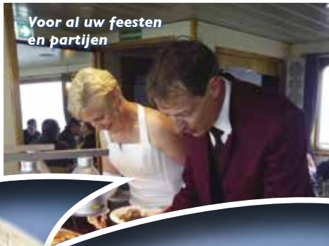
Voor al uw feesten en partijen